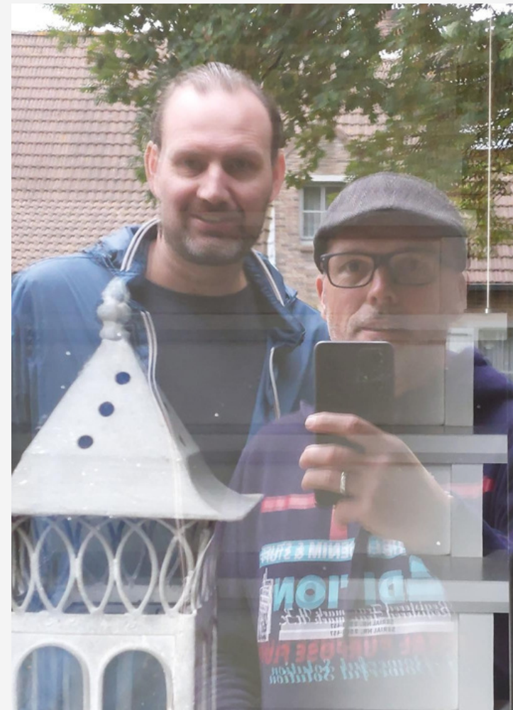
Snelle Guy Nep-inbreker